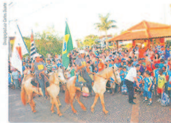
Crianças recebem os Cavaleiros da Cultura, na viagem realizada há dois anos: os livros são transportados num caminhão que acompanha o grupo