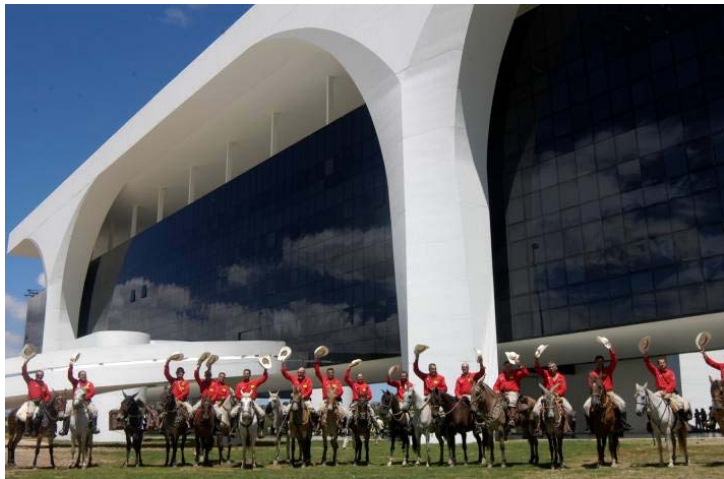
Momento da partida dos cavaleiros, na Cidade Administrativa