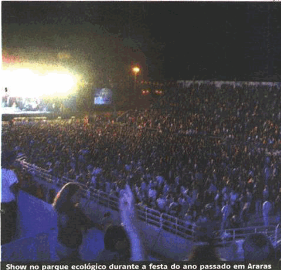
Show no parque ecológico durante a festa do ano passado em Araras