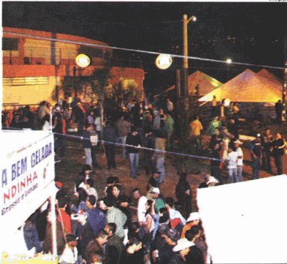
Movimentação na praça de alimentação do rodeio de Itapeverica